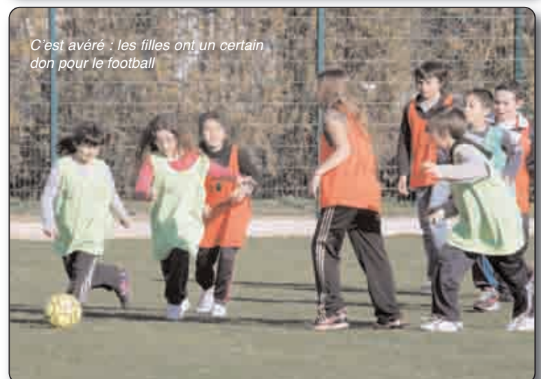
C'est avéré : les filles ont un certain don pour le football