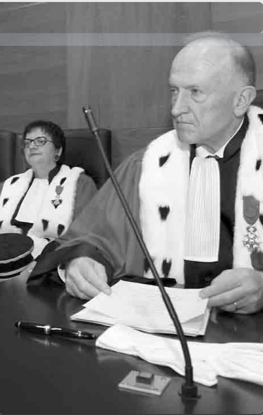
rée de la Cour d'Appel de Bastia, le 12 janvier 2012