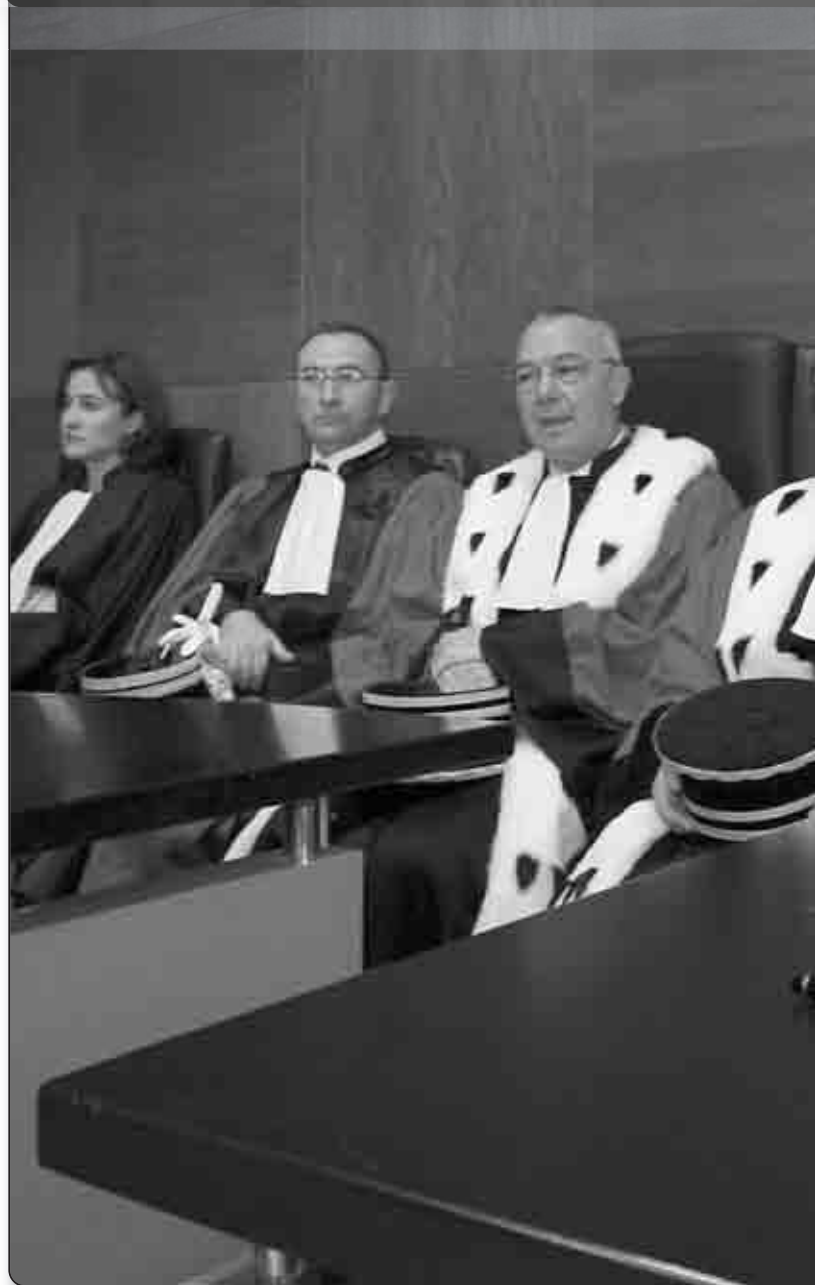
Discours du Procureur de la République Paul Michel lors de l'audience de rentrée de